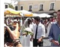
Tv, Caterina Balivo sposa a Capri